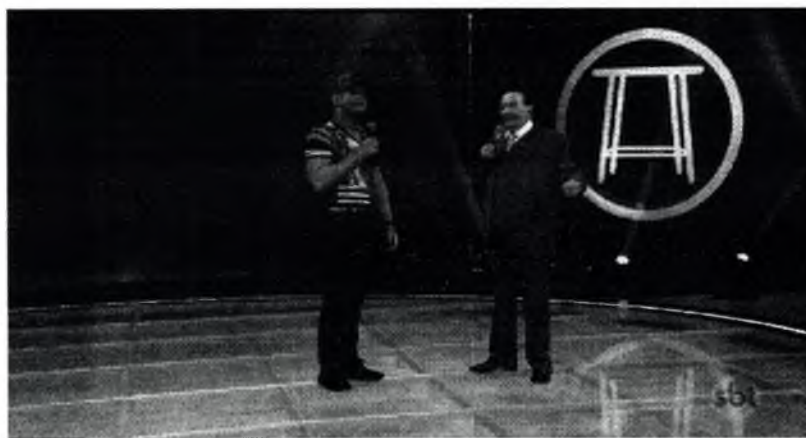
DAN VENTURA SE APRESENTA NO PROGRAMA RAUL GIL EM REDE NACIONAL (SBT)