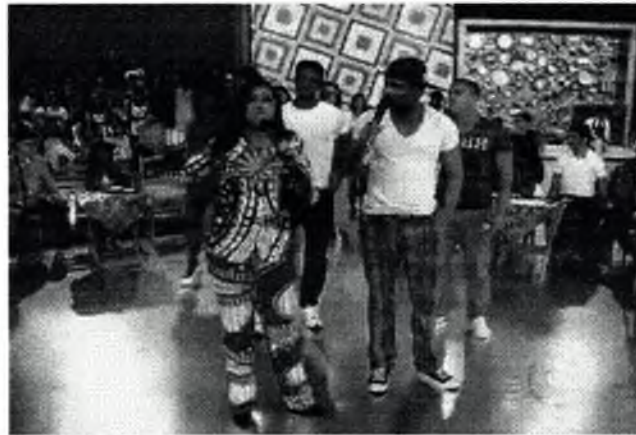
DAN VENTURA SE APRESENTA NO PROGRAMA DE REGINA CASÉ EM REDE NACIONAL (REDE GLOBO)